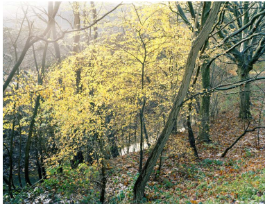
Lukas Hoffmann, Polderbos, Hoboken-Polderstad, 2008, 100 x 130 cm, c-print