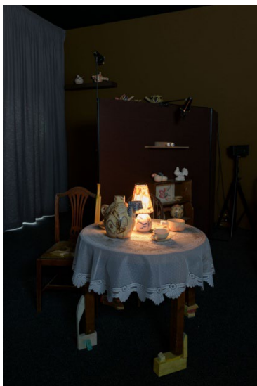
Ausstellungsansicht 1 Raum, 1 Werk. Installationen aus der Sammlung , 2026, Laure Prouvost, Wantee , 2013, Multimedia Installation, Video 14:24 Min., Ton, variable Dimensionen, Kunstmuseum Luzern, Depositum der Stiftung BEST Art Collection Luzern, vormals Bernhard Eglin-Stiftung © 2026, ProLitteris, Zürich, Foto: Marc Latzel