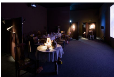
Ausstellungsansicht 1 Raum, 1 Werk. Installationen aus der Sammlung , 2026, Laure Prouvost, Wantee , 2013, Multimedia Installation, Video 14:24 Min., Ton, variable Dimensionen, Kunstmuseum Luzern, Depositum der Stiftung BEST Art Collection Luzern, vormals Bernhard Eglin-Stiftung © 2026, ProLitteris, Zürich