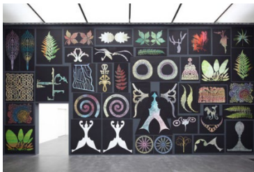
Philip Taafe, Sanctuarium. A Room for Lucerne , 2010, Monotypie, Siebdruck auf Papier, variable Dimensionen, Ausstellungsansicht Kunstmuseum Luzern 2010, Kunstmuseum Luzern, Ankauf ermöglicht mit einem Beitrag der Zuger Kulturstiftung Landis & Gyr, Foto: Andri Stadler

Auf der Homepage downloaden oder bestellen bei hannah.winters@kunstmuseumluzern.ch oder caroline.glock@kunstmuseumluzern.ch . Bitte melden Sie sich, wenn Sie Dateien von bestimmten Werken möchten.