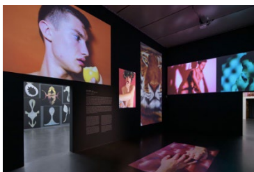
Ausstellungsansicht 1 Raum, 1 Werk. Installationen aus der Sammlung , 2026, Walter Pfeiffer, Bei dir war es immer so schön , 2023, Videoinstallation, Ton, variable Dimensionen, Kunstmuseum Luzern © 2026, ProLitteris, Zürich, Foto: Marc Latzel