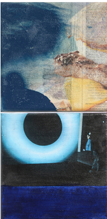
Ian Anüll, aus der Serie ohne Titel (London Blue) , 2021 Mixed Media auf Leinwand, 30 × 15 cm, Courtesy the artist und Mai 36 Galerie, Zürich, Foto: Marc Latzel