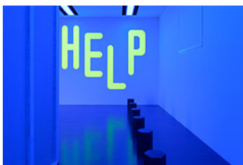
Ausstellungsansicht Ian Anüll. London Blue , Kunstmuseum Luzern, 2024 Courtesy the artist und Mai 36 Galerie, Zürich, Foto: Marc Latzel

Kontakt / Contact: eveline.suter@kunstmuseumluzern.ch or caroline.glock@kunstmuseumluzern.ch