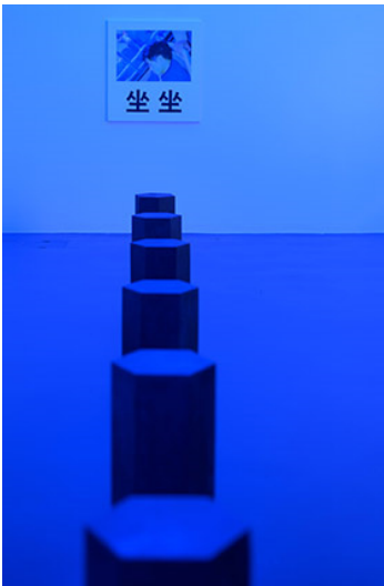
Ian Anüll, Take a Seat , 2010, Ausstellungsansicht Kunstmuseum Luzern, 2024 Courtesy the artist und Mai 36 Galerie, Zürich, Foto: Marc Latzel