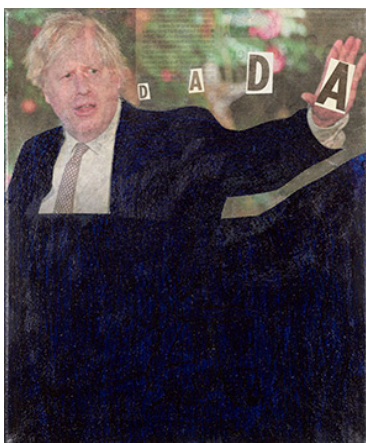
Ian Anüll, Dada by Boris , 2021 Zeitung und Acryl auf Leinwand, 30 × 24 cm