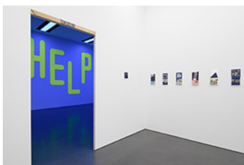
Ausstellungsansicht Ian Anüll. London Blue , Kunstmuseum Luzern, 2024