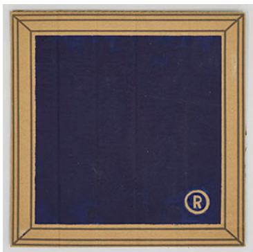
Ian Anüll, © , 2021 Acryl auf Karton, 22.5 × 22.5 cm