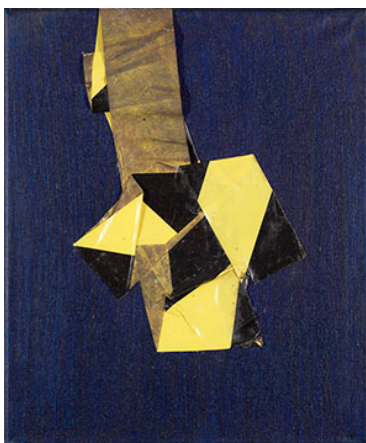
Ian Anüll, ohne Titel , 2021 Acryl und Klebeband auf Leinwand, 30 × 24 cm, Courtesy the artist und Mai 36 Galerie, Zürich, Foto: Marc Latzel