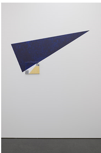
Ausstellungsansicht Ian Anüll. London Blue , Kunstmuseum Luzern, 2024 Courtesy the artist und Mai 36 Galerie, Zürich, Foto: Marc Latzel