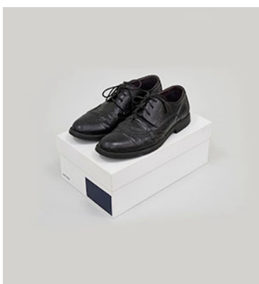
Ian Anüll, Uniform (Shoes) , 2021 Schuhe, Karton, Acryl, Courtesy the artist und Mai 36 Galerie, Zürich, Foto: Marc Latzel