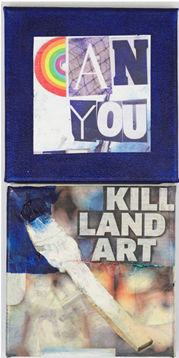
Ian Anüll, aus der Serie ohne Titel (London Blue) , 2021 Mixed Media auf Leinwand, 30 × 15 cm, Courtesy the artist und Mai 36 Galerie, Zürich, Foto: Marc Latzel