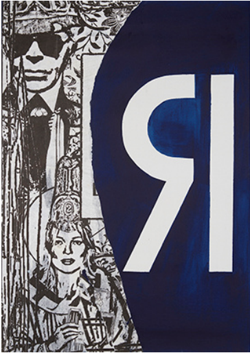
Ian Anüll, K. Moss Lagerfeld , 2021 Acryl auf Leinwand, 71 × 51 cm, Courtesy the artist und Mai 36 Galerie, Zürich, Foto: Marc Latzel