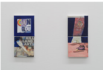
Ian Anüll, aus der Serie ohne Titel (London Blue) , 2021 Mixed Media auf Leinwand, Courtesy the artist und Mai 36 Galerie, Zürich, Foto: Marc Latzel