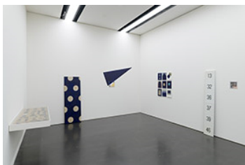
Ausstellungsansicht Ian Anüll. London Blue , Kunstmuseum Luzern, 2024 Courtesy the artist und Mai 36 Galerie, Zürich, Foto: Marc Latzel