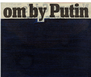
Ian Anüll, Om by Putin , 2021 Zeitung und Acryl auf Leinwand, 18 × 25 cm, Courtesy the artist und Mai 36 Galerie, Zürich, Foto: Marc Latzel