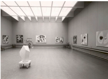
Ausstellungsansicht These, Antithese, Synthese im Oberlichtsaal mit Werken von Wassily Kandinsky, Alberto Giacometti, Jean Hélion und Hans Erni, Kunstmuseum Luzern, 1935