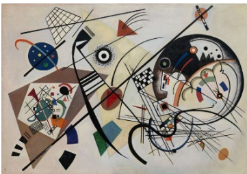
Wassily Kandinsky, Durchgehender Strich , 1923, Öl auf Leinwand, 140.8 × 202 × 2.7 cm, Kunstsammlung Nordrhein-Westfalen, Düsseldorf, erworben 1967 aus einer Spende des Westdeutschen Rundfunks