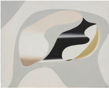
Hans Erni, Plastide , 1934, Öl auf Leinwand, 73 × 92 cm, Nachlass Hans Erni, Luzern