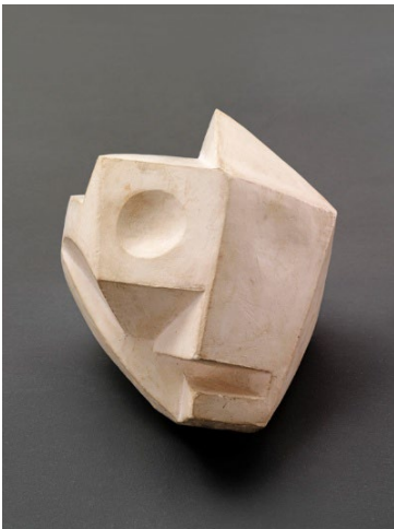
Alberto Giacometti, Tête-crâne , 1934, Gips, 18.5 × 20 × 22.5 cm, Kunsthaus Zürich, Alberto Giacometti-Stiftung, Geschenk des Künstlers, 1965 © 2025, ProLitteris, Zurich, Foto: Stefan Altenburger