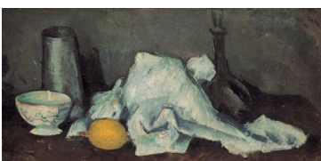
Paul Cézanne, Boîte à lait et citron, II , 1879–80, Öl auf Leinwand, 22.2 × 44 cm, Sammlung Rosengart, Luzern