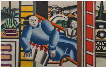
Fernand Léger, La liseuse, mère et enfant , 1922, Öl auf Leinwand, 73 × 116 cm, Privatsammlung, Schweiz © 2025, ProLitteris, Zurich