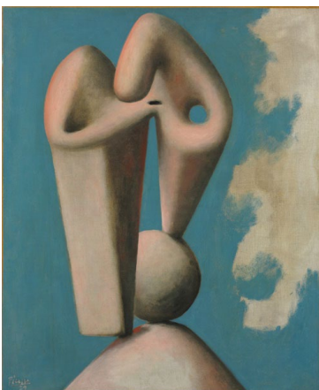
Pablo Picasso, Head: Study for a Monument , 1929, Öl auf Leinwand, 73 × 59.7 cm, The Baltimore Museum of Art: The Dexter M. Ferry, Jr. Trustee Corporation Fund [BMA 1966.41] © Successió Picasso / 2025, ProLitteris, Zurich