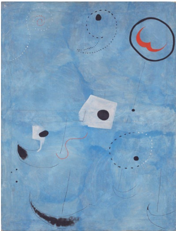
Joan Miró, Peinture , 1925, Öl auf Leinwand, 116 × 89 cm, Bayerische Staatsgemäldesammlungen, München – Pinakothek der Moderne, Foto: Sibylle Forster, Bayerische Staatsgemäldesammlungen © Successió Miró / 2025, ProLitteris, Zurich

Auf der Homepage downloaden oder bestellen bei hannah.winters@kunstmuseumluzern.ch oder caroline.glock@kunstmuseumluzern.ch . Bitte melden Sie sich, wenn Sie Dateien von bestimmten Werken möchten.