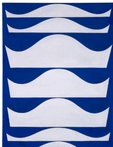
Sophie Taeuber, Echelonnement , 1934, Öl auf Leinwand, 65 × 50.8 cm, Collection du Musée de Grenoble.