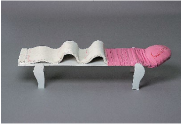
Maria Pinińska-Bereś, Becik Erotyczny (Erotischer Pucksack), 1974