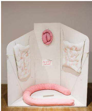
Maria Pinińska-Bereś, Mój uroczy pokój [Mein hübsches kleines Zimmer], 1975, Courtesy Archiv der Maria Pinińska-Bereś und Jerzy Bereś Foundation, Foto: Marek Gardulski