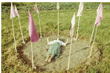
Maria Pinińska-Bereś, Modlitwa o deszcz [Gebet um Regen], 1977, Dokumentation der Performance, Courtesy Archiv der Maria Pinińska-Bereś und Jerzy Bereś Foundation