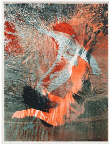
Shirana Shahbazi, Falling_05 (Green & Red) , 2024, zweifarbige Lithografie auf Baumwollpapier, 160 × 120 cm, Ed. von 1 (+ 1 AP), Courtesy of the artist und Galerie Peter Kilchmann, Zürich, Paris