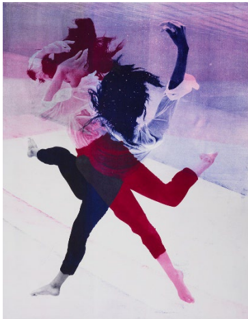
Shirana Shahbazi, Falling Sima 06 , 2026, Courtesy of the artist

Auf der Homepage downloaden oder bestellen bei hannah.winters@kunstmuseumluzern.ch oder caroline.glock@kunstmuseumluzern.ch . Bitte melden Sie sich, wenn Sie Dateien von bestimmten Werken möchten.