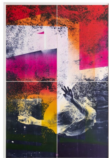
Shirana Shahbazi, Falling_01 , 2023, dreifarbige Lithografie auf Baumwollpapier, vier Blätter, 240 × 160 cm, Ed. von 2 (+ 1 AP), Courtesy of the artist und Galerie Peter Kilchmann, Zürich, Paris