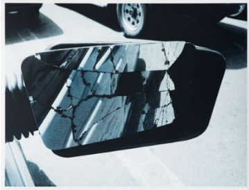
Shirana Shahbazi, Spiegel , 2014, zweifarbige Lithografie auf Zerkall Büttenpapier, 67 × 87 cm, Ed. von 4 (+ 1 AP), Courtesy of the artist und Galerie Peter Kilchmann, Zürich, Paris