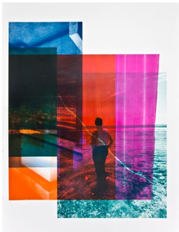
Shirana Shahbazi, Teacher , 2019, vierfarbige Lithografie auf Baumwollpapier, 120 × 90 cm, Ed. von 3 (+ 1 AP)