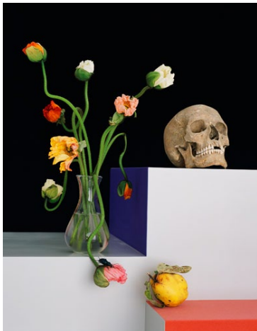
Shirana Shahbazi, Stilleben-33-2007 , 2007, C-Print auf Aluminium, 150 × 120 cm, Ed. von 5 (+ 1 AP), Courtesy of the artist und Galerie Peter Kilchmann, Zürich, Paris