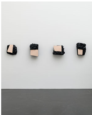
Henri Spaeti, Pittura materica , 2023/2024

Auf der Website [ https://www.kunstmuseumluzern.ch/medien ] downloaden oder bestellen bei eveline.suter@kunstmuseumluzern.ch . Bitte melden Sie sich, wenn Sie Dateien von bestimmten Werken möchten.