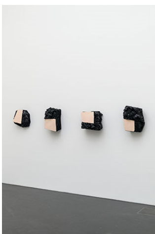
Henri Spaeti, Pittura materica , 2023/2024