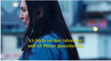
Dominik Zietlow, Taube Feuer , 2023, Filmstill, Einkanal-Video, 45 Min., Ton