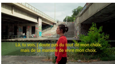
Dominik Zietlow, Le rouge dans le bleu , 2024, Filmstill, Einkanal-Video, 23 Min., Ton