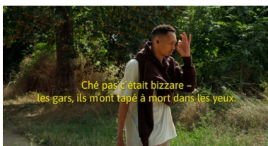
Dominik Zietlow, Le rouge dans le bleu , 2024, Filmstill, Einkanal-Video, 23 Min., Ton, Courtesy of the artist