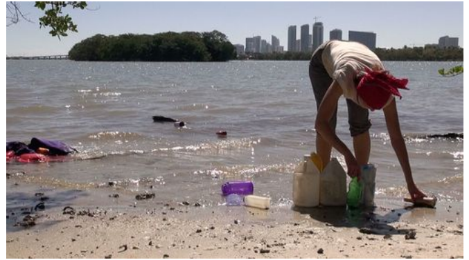
→ Picnic Island 2018