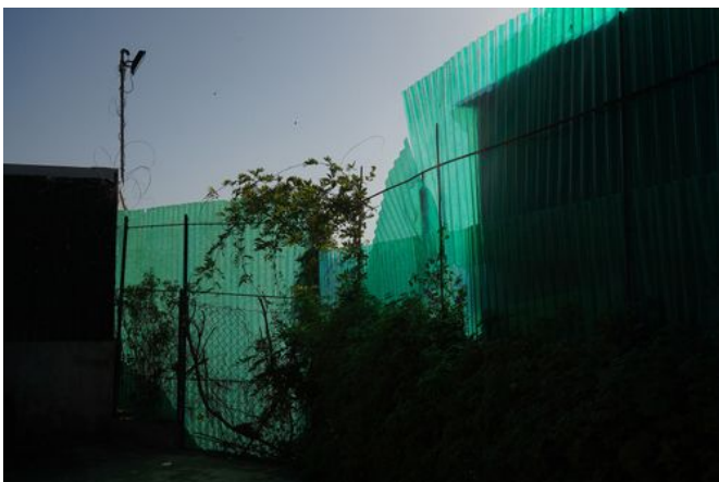
→ Punta Vagno 2024