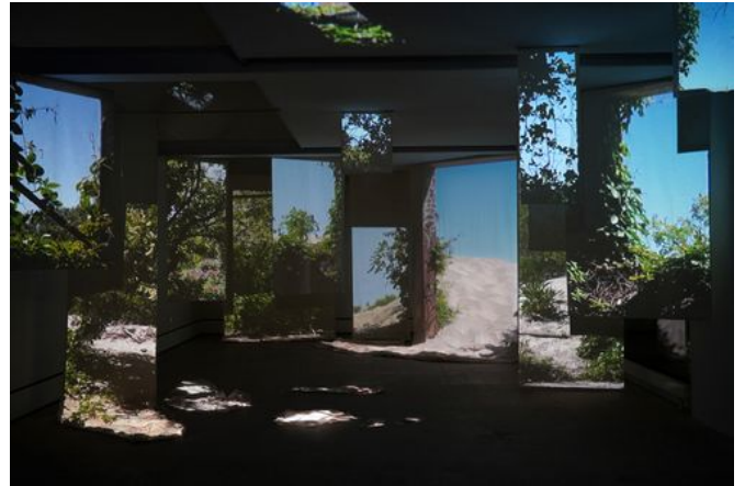
→ Outpost 2020