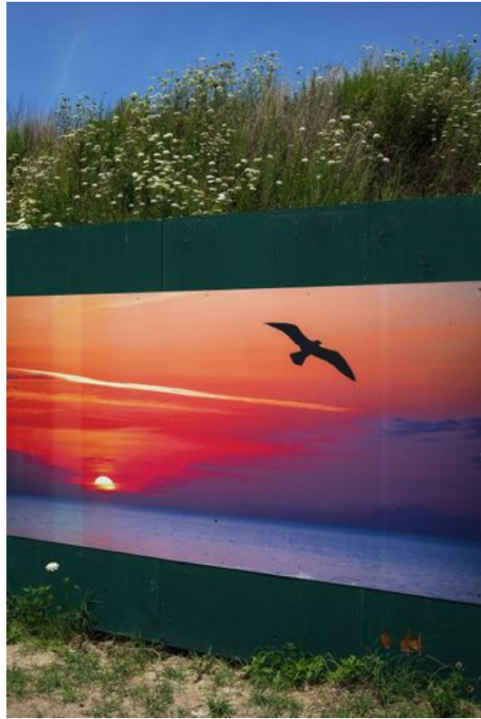
→ Arverne 2022