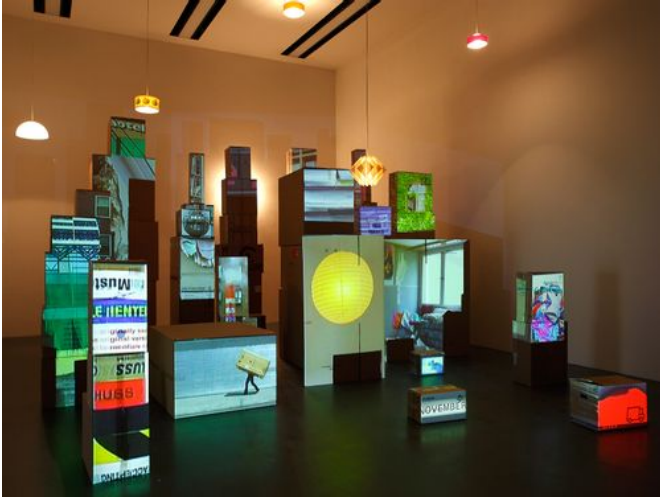
→ Inner and Outer Spaces 2010