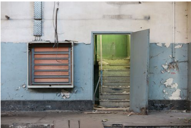
→ Teupitz 2017