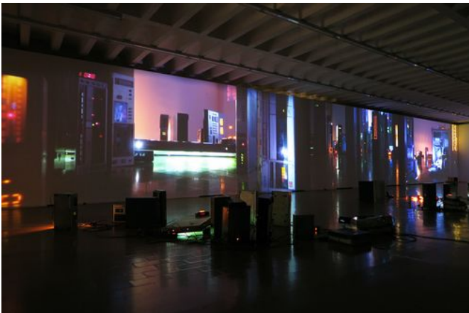
→ Archipel 2013 / 2017