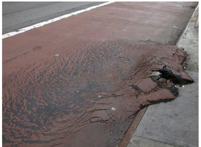
→ Midtown 2017