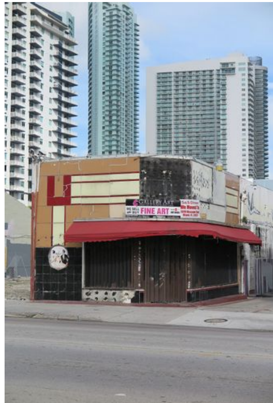
→ Edgewater 2018