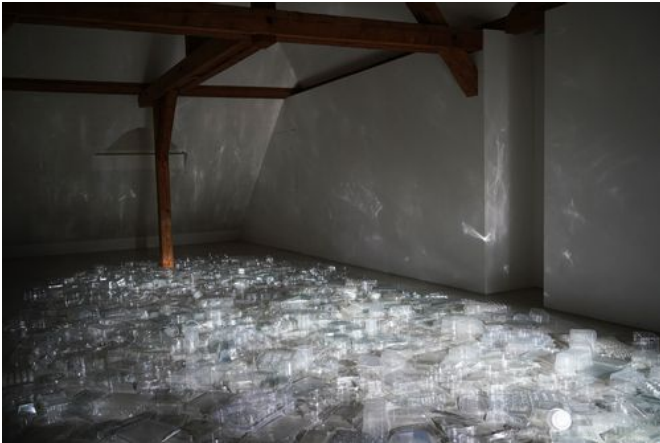
→ flunkern 2020