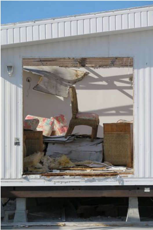
→ Goodland 2018