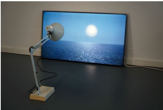
→ Lungomare 2023