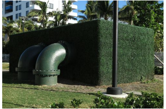
→ South Beach 2018