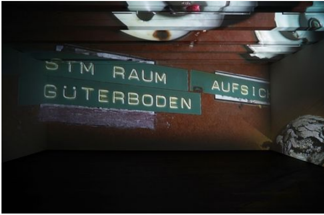
→ Irrlichtern 2022