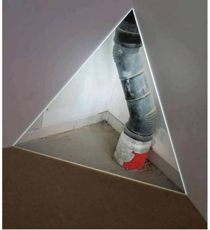
→ Eck-Stück Nr. 4 2012