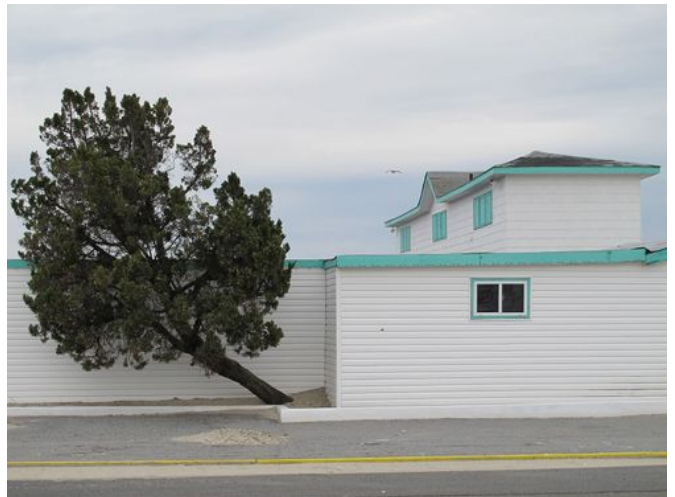
→ Atlantic Island 2017