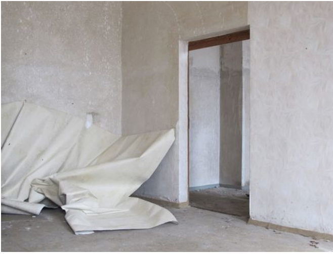
→ Krampnitz 2017