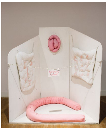
Maria Pinińska-Bereś, Mój uroczy pokój (Mein hübsches kleines Zimmer), 1975